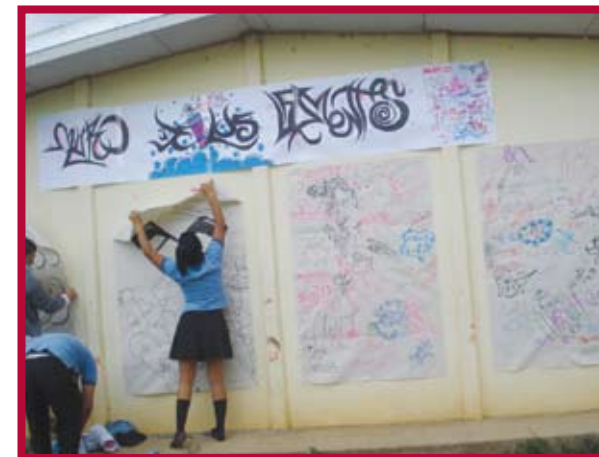
Muro de los Lamentos