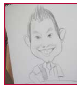
Dibujo tipo Manga