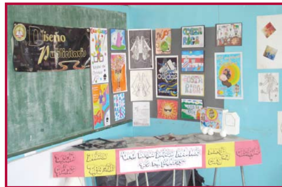
Certamen de arte